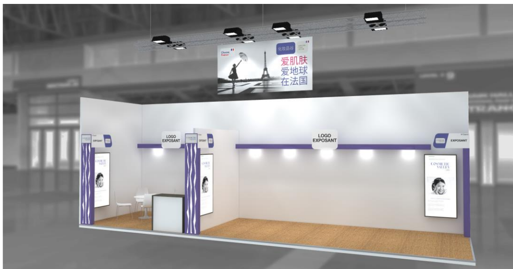
Image du design 2023 non contractuelle

La formule comprend un stand construit/équipé remis « clé en mains » et des services connexes :